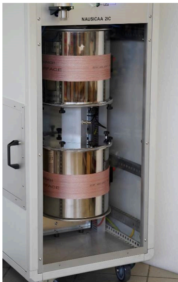
Camere a ionizzazione gemelle da 10 l