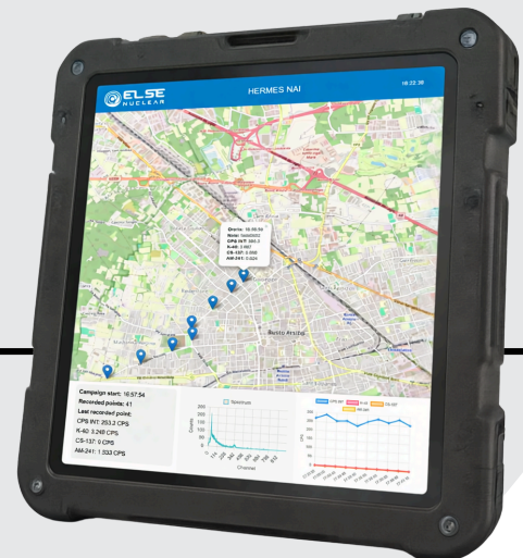
Esempio di tablet di controllo con web interface