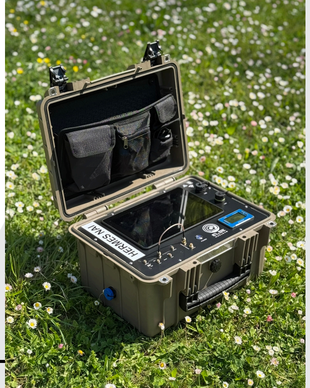
HERMES NAI in uso sul campo